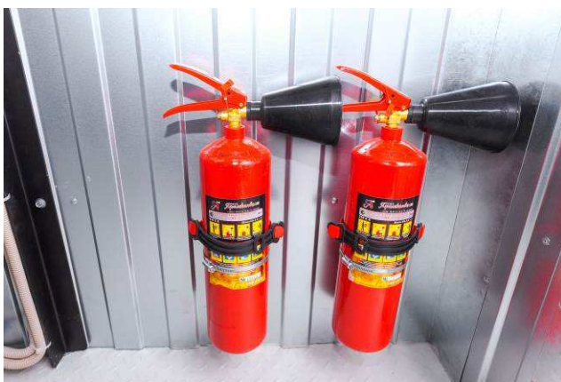
Огнетушители типа ОП