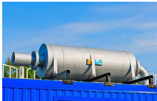
Промышленный глушитель с искрогасителем на крыше контейнера