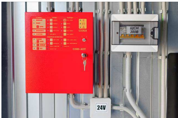
Система пожарной/охранной сигнализации на базе прибора С2000АСПТ и щит собственных нужд контейнера (ЩСН)