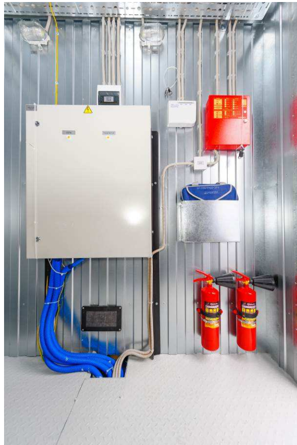
ОПЦИЯ: Шкаф автоматического ввода резерва (АВР)