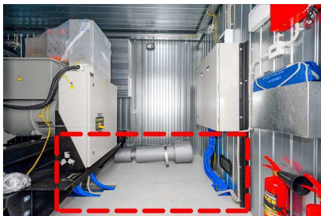
В полу контейнера расположена скрытая магистраль для прокладки силовых кабелей и прочей электроразводки