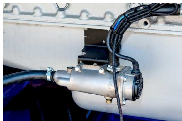
Электрический подогреватель охлаждающей жидкости