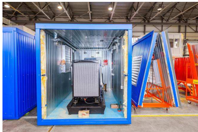
Быстроразъемная торцевая стена для удобства монтажа / демонтажа оборудования, ремонта ДЭС