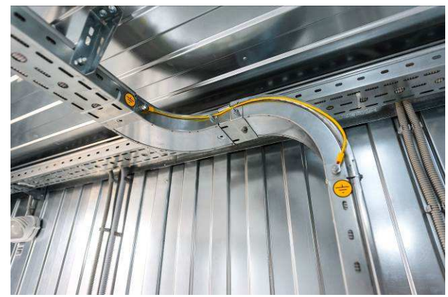
Верхняя разводка кабелей в гофрированных трубах - в подвесных металлических коробах (подвесные системы ДКС, Италия)