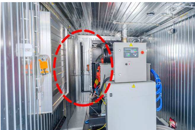
«Дыхательный» клапан для отвода паров топлива из топливного бака за пределы контейнера