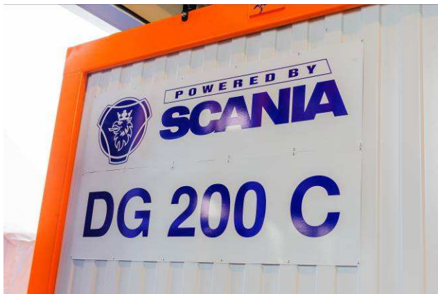
Снаружи несущий каркас обшивается профилированной оцинкованной листовой сталью со стойким ПВХ покрытием