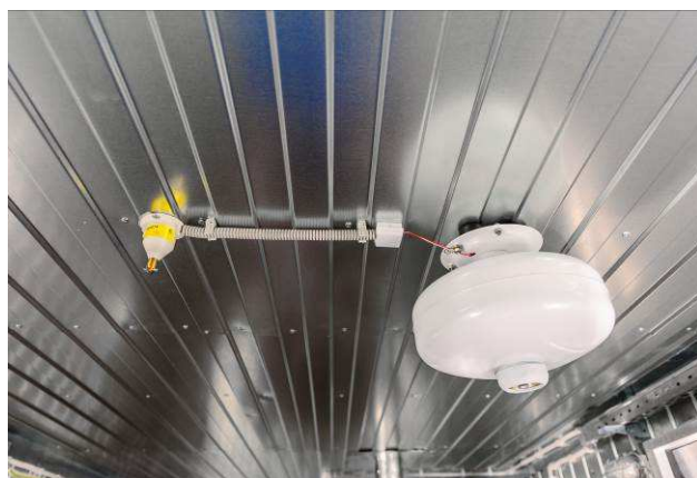
Модуль порошкового пожаротушения Тунгус