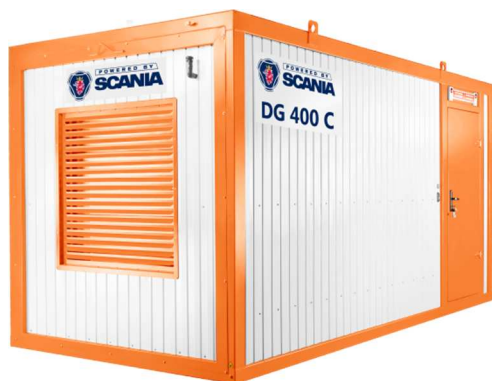
Снаружи на проемы вентиляции устанавливаются антивандальные жалюзийные решетки со складными козырьками типа «конверт»