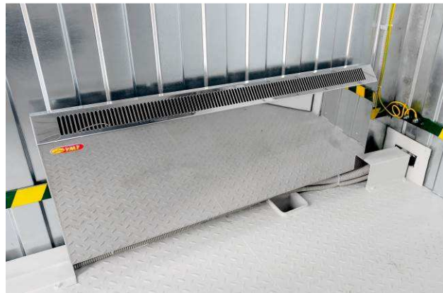
Электроконвектор 220 В с автоматическим регулятором