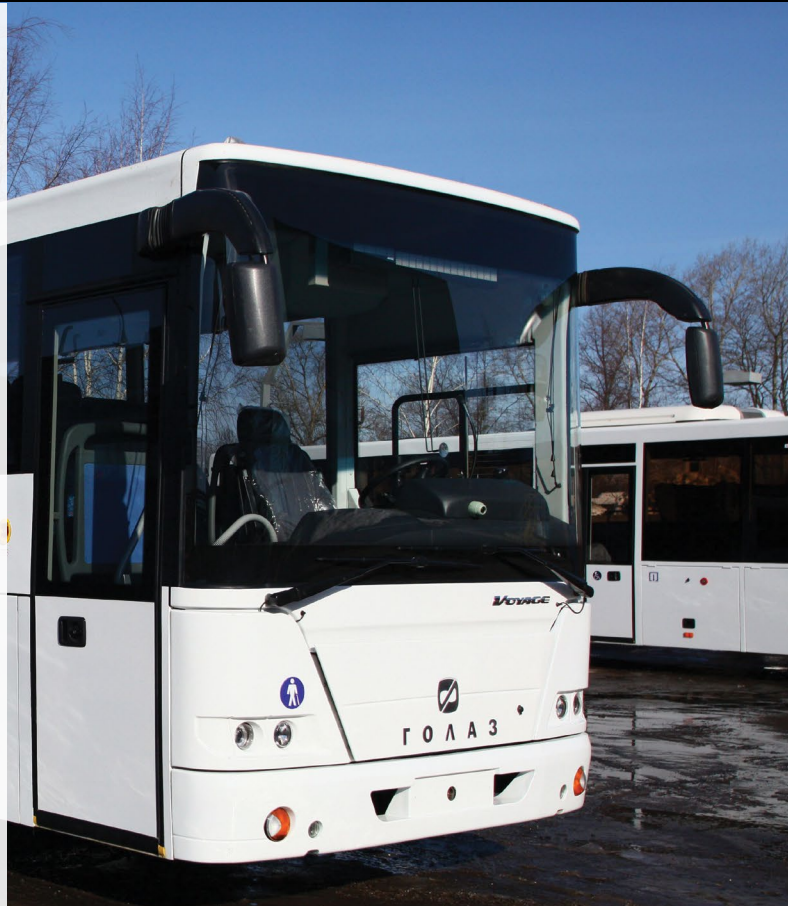
Пригородные/Междугородные автобусы ЛИАЗ-5251 «Вояж» на шасси Scania

Преимущества ЛИАЗ «Вояж»: повышенная пассажирореместимость, надёжность агрегатной базы, высокая остаточная стоимость.