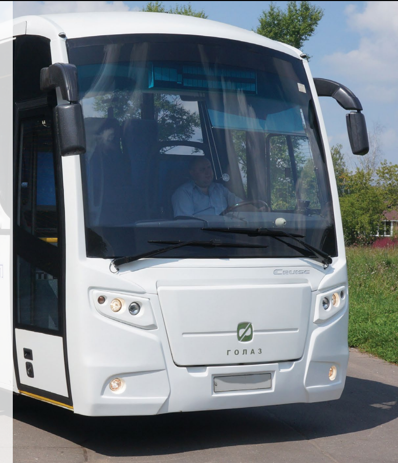
Междугородные/Туристические автобусы ЛИАЗ-529115 «Крузи» на шасси Scania

Преимущества ЛИАЗ-«Крузи»: комфорт для пассажиров, отличная эргономика рабочего места водителя, экономичность в эксплуатации.